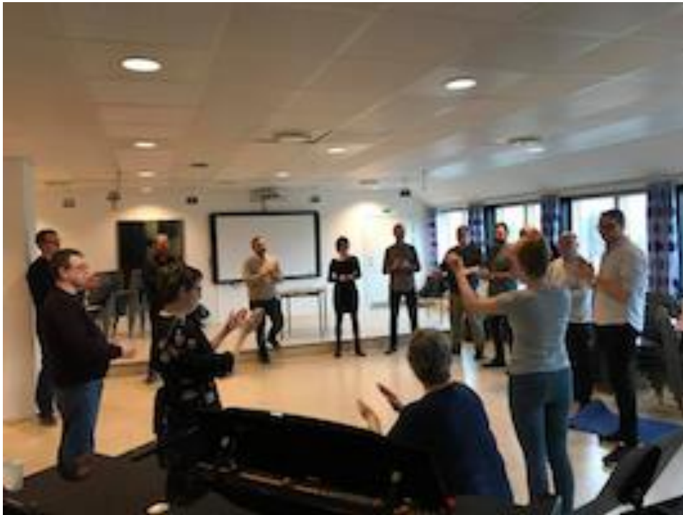
Udvælgelsesdag i Kolding.

stadig stod åbent om vi havde råd til at gennemføre kurserne i 2018. Udvalget havde opfordret os til at gå i samarbejde med Dirigentinstituttet under foreningen Danske Orkesterdirigenter, og der er gjort ihærdige forsøg på at få dette samarbejde i stand, men uden resultat, så dirigenterkursernes fremtid er meget usikker.